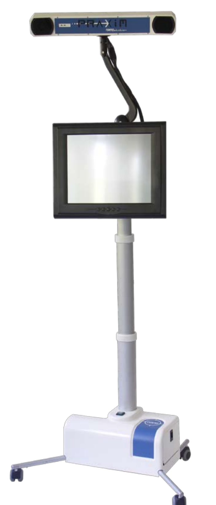
Nano Station® 2006