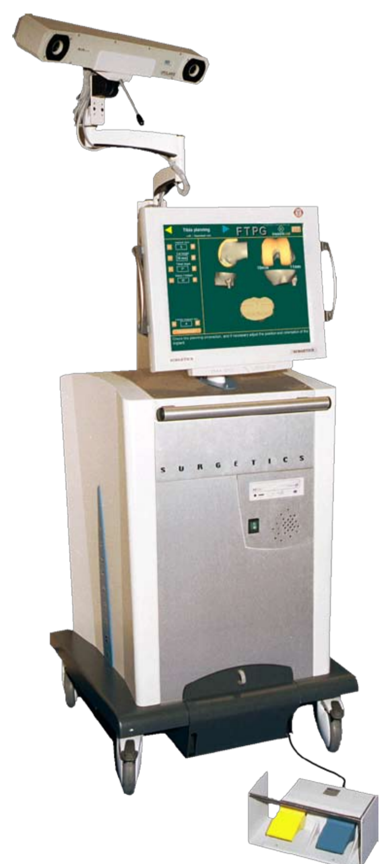
Surgetics Station® 2001